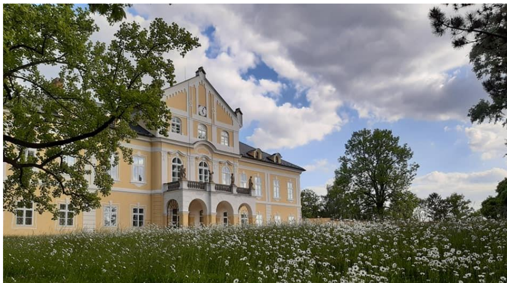
Zámek Nová Horka

Do finální prestižní nominace, v níž jsou zařazena TOP místa Moravskoslezského kraje, byly vybrány tři z atraktivit navrhovaných Destinačním managementem turistické oblasti Poodří – Moravské Kravařsko, o.p.s., – už zmíněný Flascharův důl a zámky Nová Horka a Kunín.