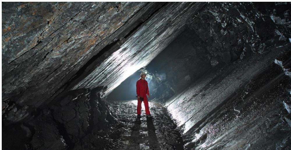
Flascharův důl v Odrách

Do finální prestižní nominace, v níž jsou zařazena TOP místa Moravskoslezského kraje, byly vybrány tři z atraktivit navrhovaných Destinačním managementem turistické oblasti Poodří – Moravské Kravařsko, o.p.s., – už zmíněný Flascharův důl a zámky Nová Horka a Kunín.