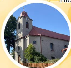
Kostel Navštívení Panny Marie