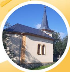
Kaple sv. J. Nepomuckého