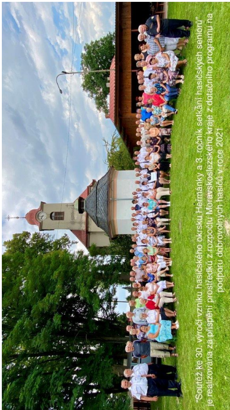
“Soutěž ke 30. výročí vzniku hasičského okresu Heřmanky a 3. ročník setkání hasičských seniorů” je realizována za přispění prostředků z rozpočtu Moravskoslezského kraje z dotačního programu na podporu dobrovolných hasičů v roce 2021