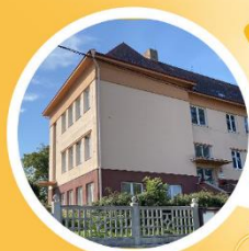
Základní škola a Obecní úřad