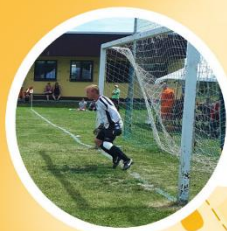
Hřiště TJ Rozkvět