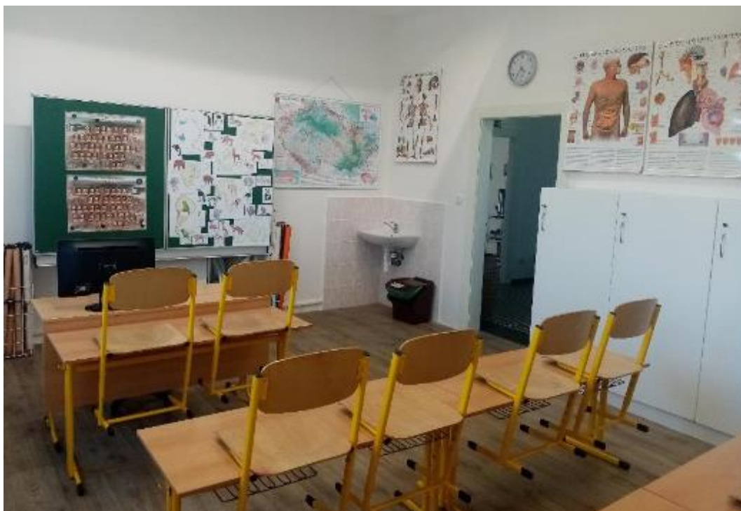
Bývalá sborovna přeměněna na multifunkční učebnu

Zvykem už se stala skutečnost, že přes letní prázdniny sice škola utichne křikem a smíchem dětí, ale živo je ve škole stále. Prázdniny se využívají k nutným opravám, údržbě a povinné výmalbě. Letos přišla na řadu výměna vstupních prosklených dvoukřídlých dveří hlavního vchodu a nová pokládky podlahové krytiny v chodbách. Dále se pokračovalo stěhováním. Místo sborovny se vybuďovala nová multifunkční učebna, určena především k dělení vyučovacíh hodin početného prvního a druhého ročníku. Pro pedagogický sbor se vybuďovala nová sborovna.