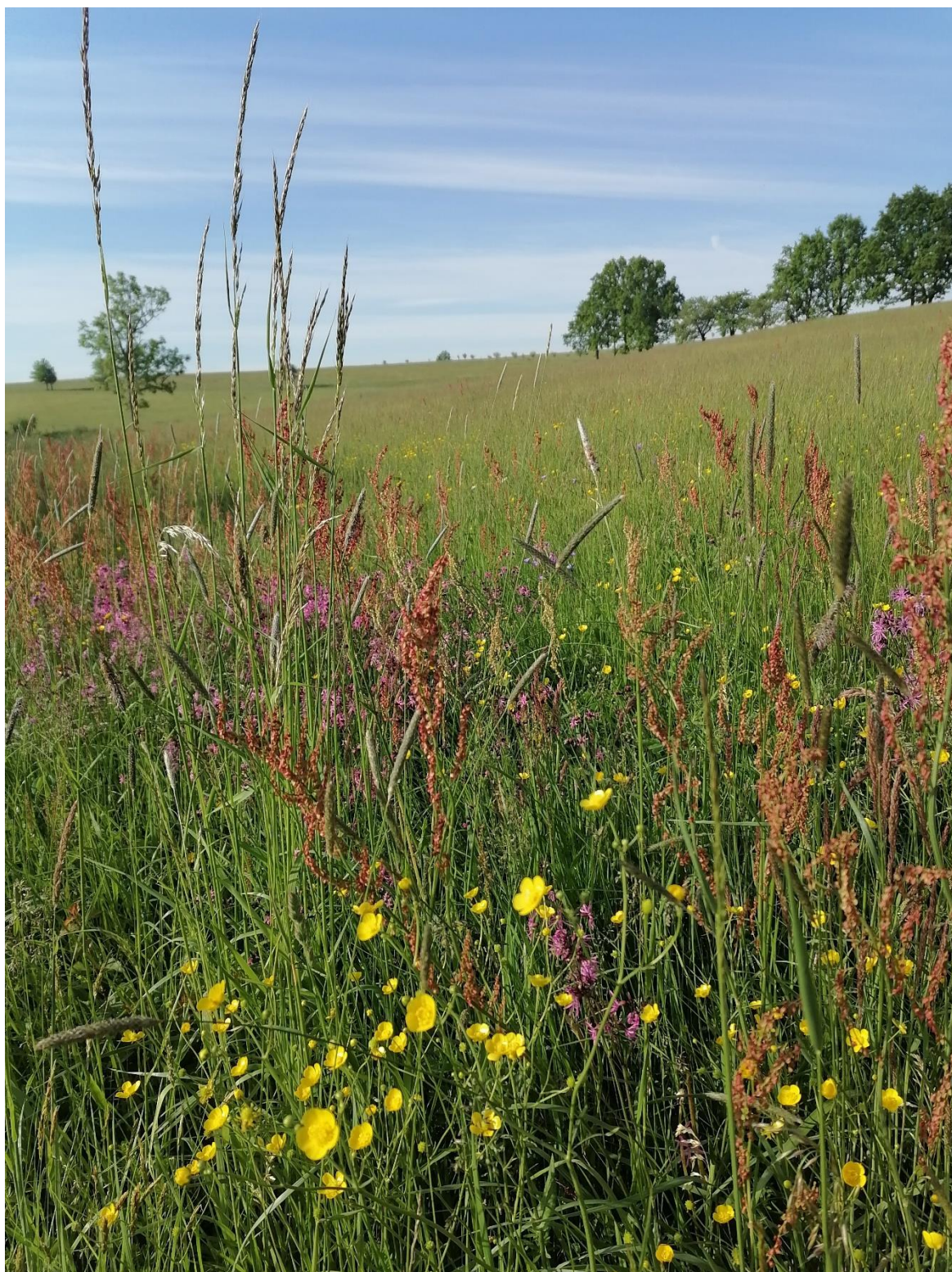
Luční kvítí na Staré oderské cestě