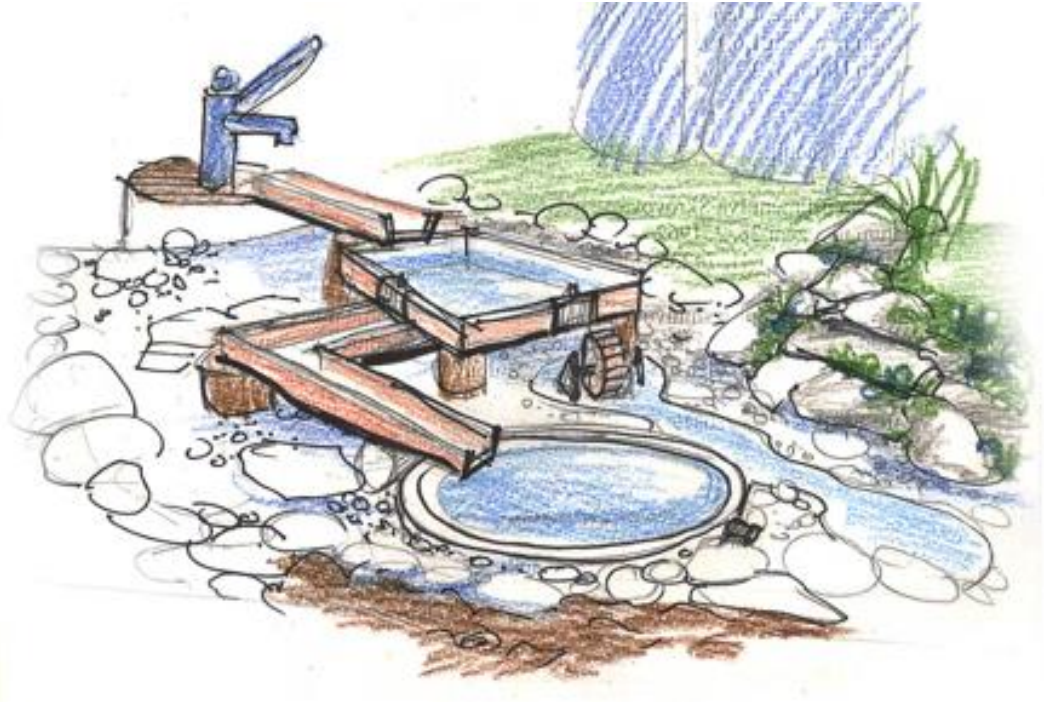
Návrh vodní hry navazující na stávající studnu