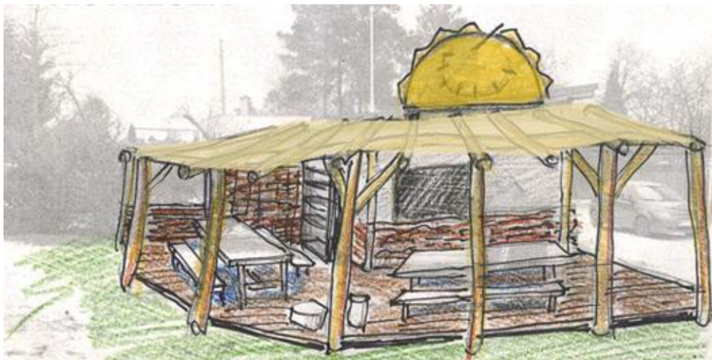
Návrhy jezírka a přístřešku dle projektové dokumentace