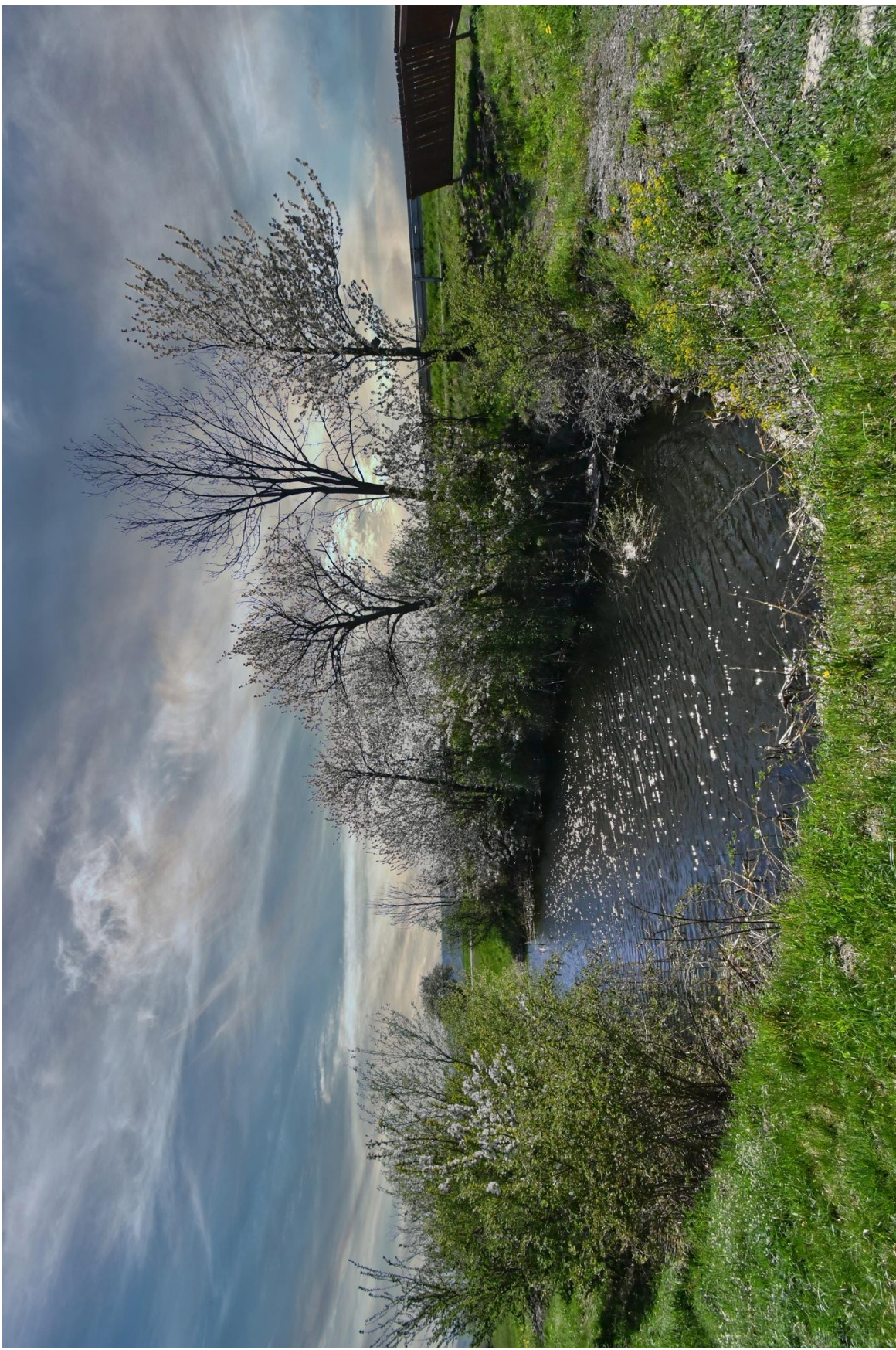
Mořské oko v rozkvětu