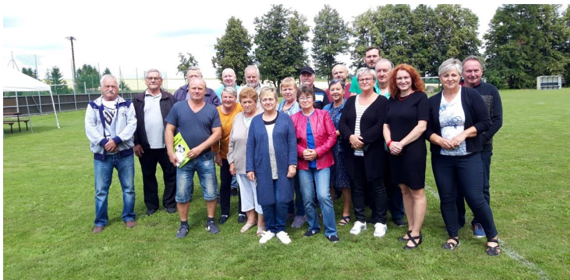
Zakladatelé spolku, členové výboru a vedení obce

Počasí ovlivnilo také průběh tradičního červencového turnaje, od začátku slunečný a teplý den přerušil déšť. Letošní konání tohoto turnaje bylo pro TJ Rozkvět Heřmanice u Oder jubilejní. Členové spolku tak oslavili 50 let od svého založení. Spolu se zakladateli, bývalými členy a vedením obce zavzpomínali na uplynulé sportovní zážitky. Na památku byly pozvaným předány pamětní plakety a fotoknihy s fotografiemi od založení spolku po současnost.