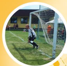
Hřiště TJ Rozkvět