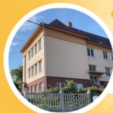
Základní škola a Obecní úřad