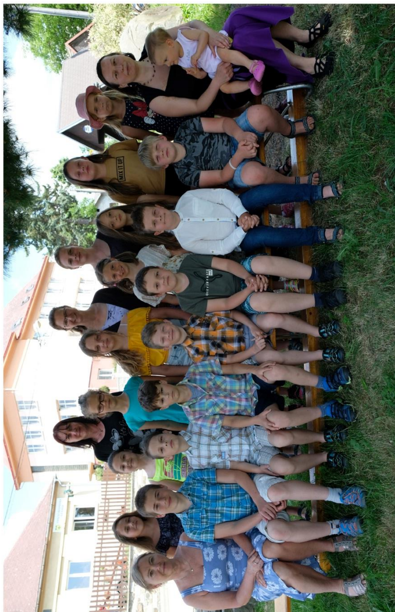
ZŠ Heřmanice u Oder