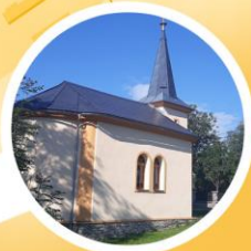
Kaple sv. J. Nepomuckého