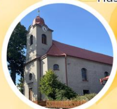
Kostel Navštívení Panny Marie